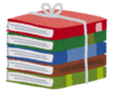
雑誌類・古い教科書