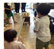
【2年生の研究授業の様子】

研究主題を「子ども同士の関わりの中で生き生きとできる子ども」と設定し、幼児教育からの円滑な接続を2か年で研究してきました。特に、今年度は、幼児教育における環境構成を小学校教育にも生かす授業づくりをめざし、「学習活動の工夫」「物的環境の工夫」「空間的環境の工夫」「教師の役割」の4つを手だてとして各学年で研究授業を行いました。