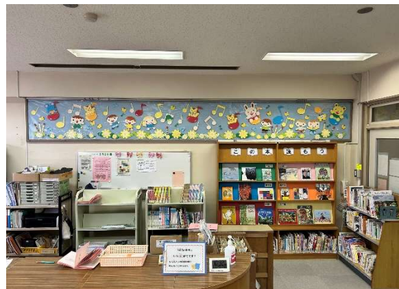
↑3月5日ひなまつりの飾りから春の飾りに貼り換えました。