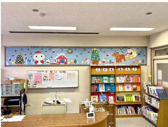
↑クリスマスの装飾は子どもたちの人気が高くて高い飾りです

整備・装飾グループは、年間17回の設定の中、ボランティアさんのご都合の良い日にご参加いただきました。参加人数は1回平均4~5人ですが、8人くらいで活動できると図書館の環境をもっともっと整えることができると考えています。