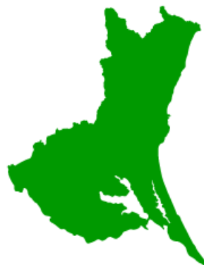
( いばらきけん 茨城県 )