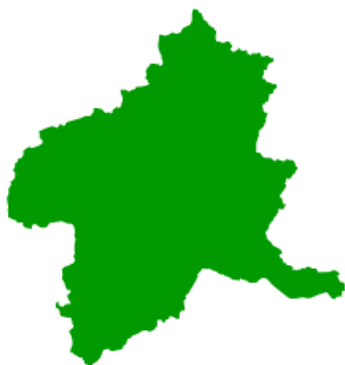
( ぐんまけん 群馬県 )