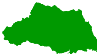
( さいたまけん 埼玉県 )