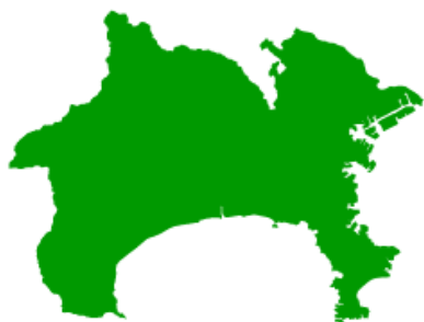
( かながわけん 神奈川県 )