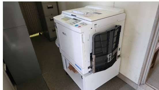
写真②（移設された印刷機）