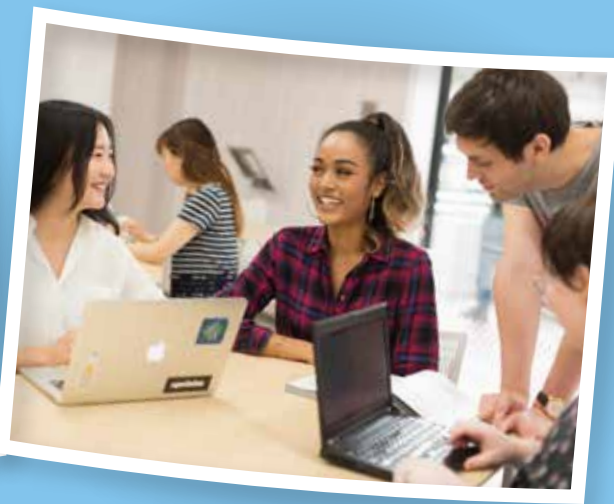
テンブル大学ジャパンキャンパスの学生たち