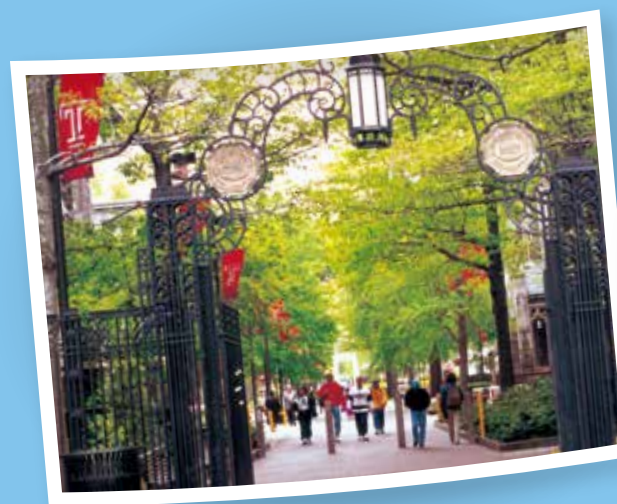
テンブル大学アメリカ本校