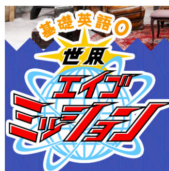
エイゴミッション