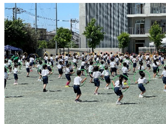
2年生 まわすまわす! マスカット