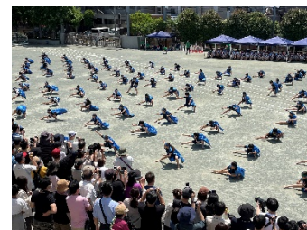
5年生 南中ソーラン