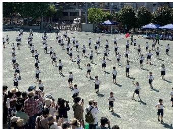
1年生 1,2,3でゲットだぜ!

今年も日本大学SSG(スクールサポートグループ)・松沢小PTA・その他たくさんの方々にご支援をいただき、誠にありがとうございました。