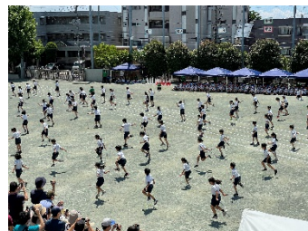
4年生 4tune! 2022