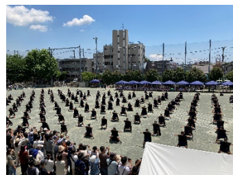
6年生 Last Gift ~感謝~