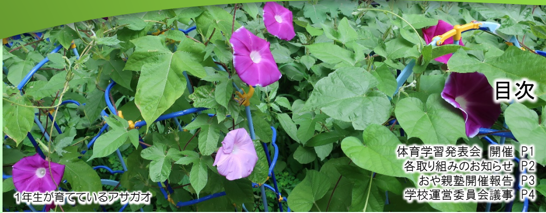
1年生が育てているアサガオ

積極的に地域の方々が学校の教育活動を支援することで、子供がより多くの大人に接する機会を増やし、子供の視野を広げることに繋がっていきます。