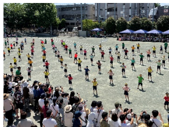
3年生 Step by step