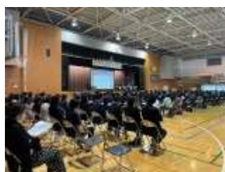
研究発表会の様子