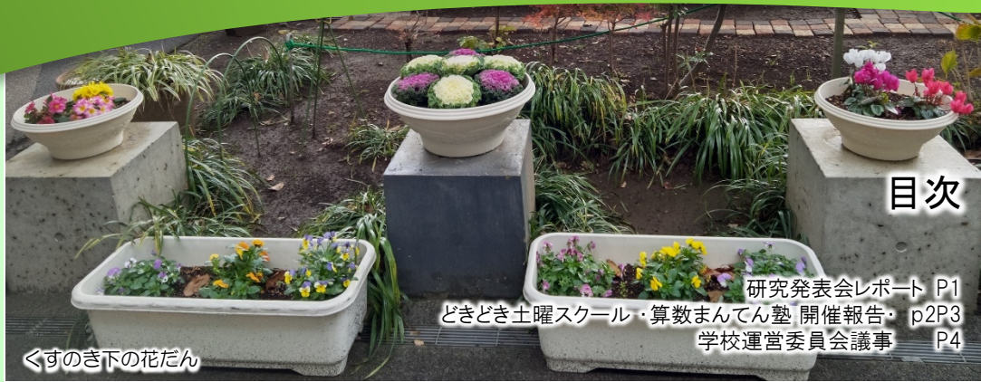
くすのき下の花だん

積極的に地域の方々が学校の教育活動を支援することで、子供がより多くの大人に接する機会を増やし、子供の視野を広げることに繋がっていきます。