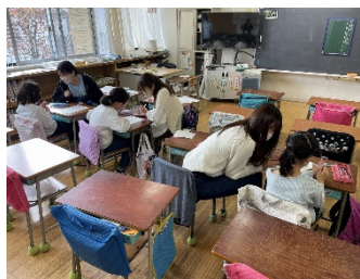
ほぼマンツーマンの指導

「たし算・ひき算・かけ算・わり算・単位・時間」の6単元の中から、不得意な単元を中心に学習をすすめました。今回もボランティアで先生役を引き受けてくださった日本大学SSGのお兄さんお姉さんに、分からない部分を丁寧に教えてもらいました。