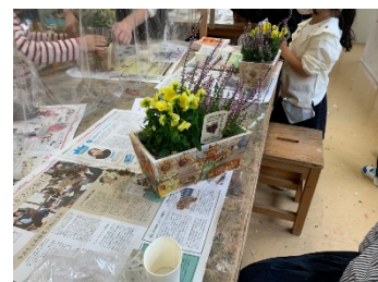
デコパージュにチャレンジ