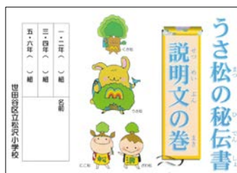
学び方の習得のための秘伝書

来年度は、研究領域を文学的な文章に発展させ、文学的な文章の学び方習得に向けた「うさ松の秘伝書」も作成する予定とのこと。さらに、松沢小学校の子供たちの読みの力や表現力が高まる研究となることを期待しています。