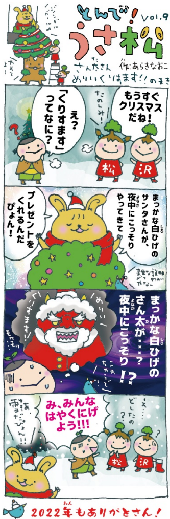
2022年もありがとうございます！