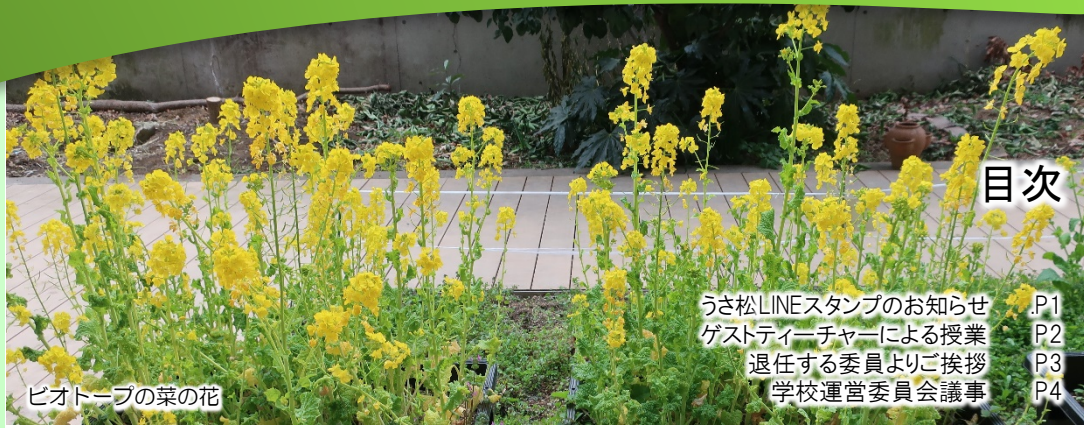
ビオトープの菜の花

積極的に地域の方々が学校の教育活動を支援することで、子供がより多くの大人に接する機会を増やし、子供の視野を広げることに繋がっていきます。