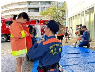
消防服の重さを実感