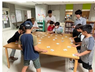
防災かるたで学ぶ