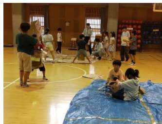
みんなで寝床の準備