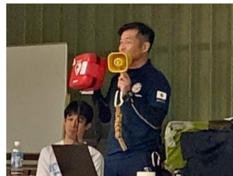
AEDについて学びます