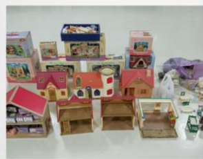
シルバニアファミリー