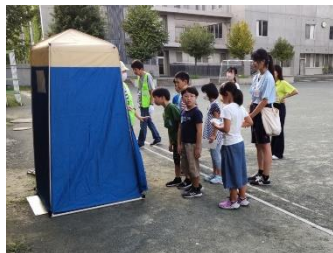
マンホールトイレ