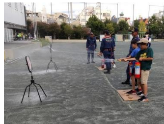
消火作業も体験しました