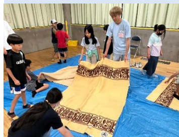
非常時の毛布の使い方