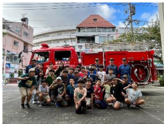
消防車を間近で見学

9月9日、どきどき土曜スクールの第1回として、「避難所を体験しよう!」が開催されました。多くの応募の中、当選した29名の児童が参加してくれました。日中は消防署による訓練実演や消防車の見学をしたあと、避難所運営委員によるマンホールトイレ設営や消防団による初期消火訓練など、普段の生活ではできない体験をしました。