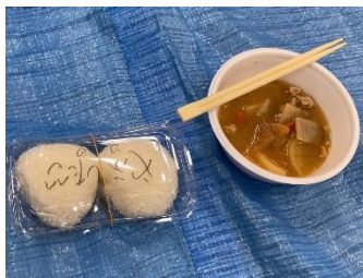
炊出しはおにぎりとお汁

また夜には、新型コロナウイルスの感染拡大を受けて2020年より自粛をしていた避難所(体育館)での宿泊体験を、4年ぶりに実施しました。ダンボールの上にブルーシートを敷いた床の上で、配給される毛布で一晩を過ごす体験をしてもらいました。