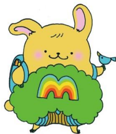
松沢小学校公式キャラクター うさ松