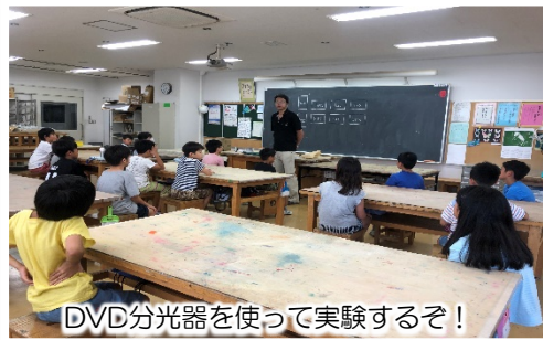
DVD分光器を使って実験するぞ！