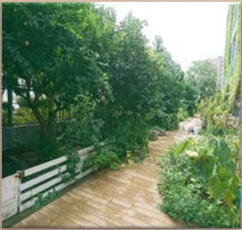
避難するウサギ達