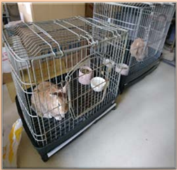
避難後のウサギ小屋