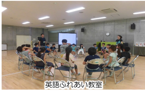
英語ふれあい教室