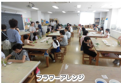
フラワーアレンジ