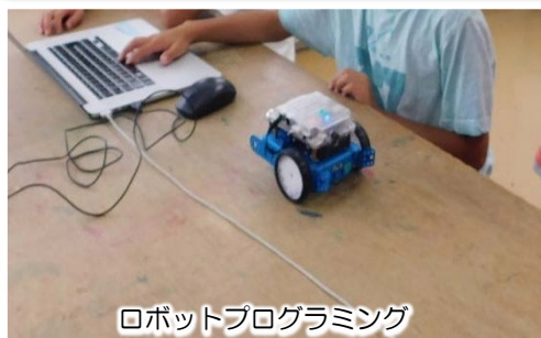
ロボットプログラミング