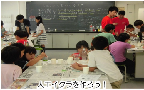
人工イクラを作ろう！