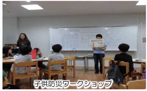
子供防災ワークショップ