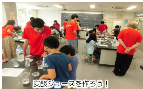
炭酸ジュースを作ろう！