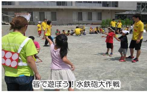
皆で遊ぼう! 水鉄砲大作戦