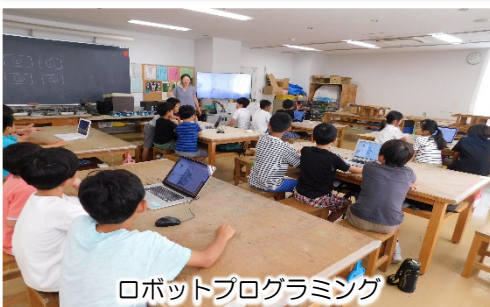
ロボットプログラミング