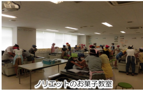
ノリエットのお菓子教室