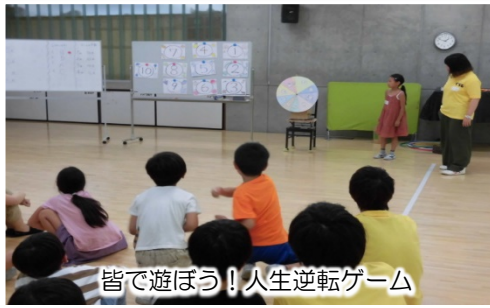
皆で遊ぼう！人生逆転ゲーム