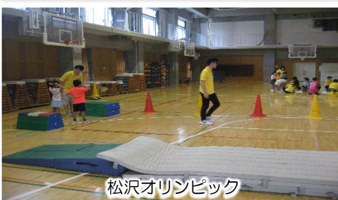
松沢オリンピック