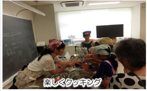
楽しくクッキング