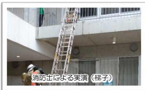
消防士による実演(梯子)