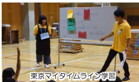
東京マイタイムライン学習