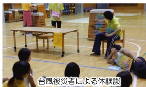
台風被災者による体験談