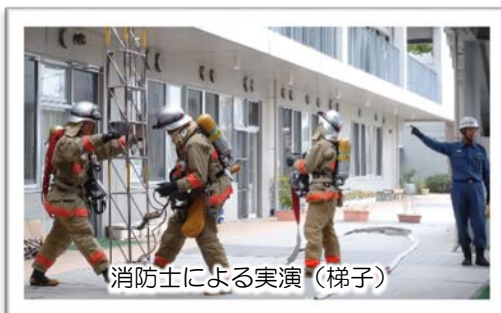
消防士による実演(梯子)