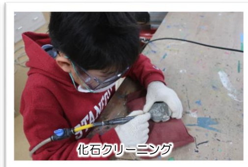
化石クリーミング