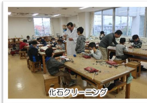
化石クリーミング