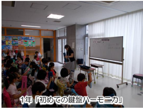
1年「初めての鍵盤ハーモニカ」