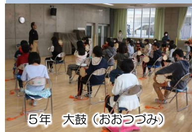
5年 大鼓(おおつづみ)