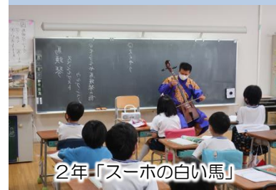
2年「スーホの白い馬」