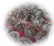
ココアカップケーキ