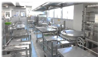
給食室には、大きな釜が4つあります。