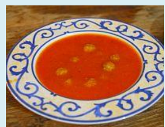
トマトウンスープ