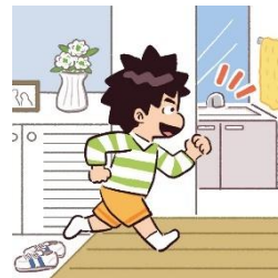
外出から帰ったあと