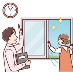
こまめに換気する