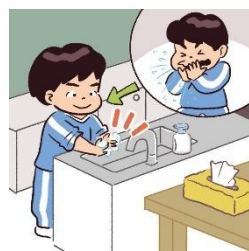
咳やくしゃみのあと