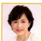
水野真紀 俳優 他

公式ホームページ https://jigyuu.yomiuri.co.jp/photo-essay/