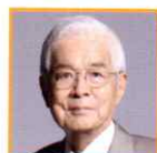
養老孟司 東京大学名誉教授 /解剖学者