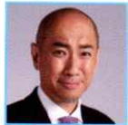
熊切大輔 日本写真家協会会長