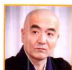
玄侑宗久 作家 / 福聚寺住職