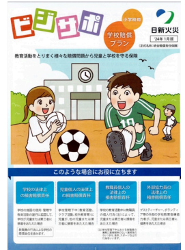
ビジサボ学校賠償プラン