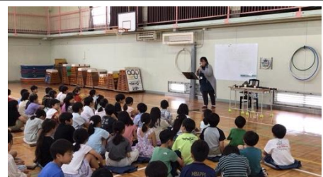
「リコーダー講習会」