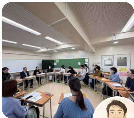
第五回運営委員会(1/17)の様子 教職員・PTA役員・委員会・有志の会で 集まり、下校時の見守りや来年度に向け ての協議を行いました