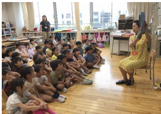
2年生：目線が全員、本に向いています。

少し時間のある夏休み、時間をかけて何かに取り組んでみる良い機会です。その一つに、子どもたち、そして大人も、「お気に入りの本を見つけてみる」というのはいかがでしょうか。