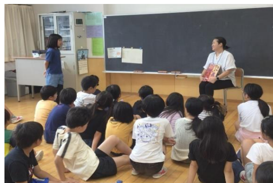
4年生：進んで挙手し、「同じ道具を持っても、使う人の心によって結果がどうなるかは違う」と感想を伝えていました。