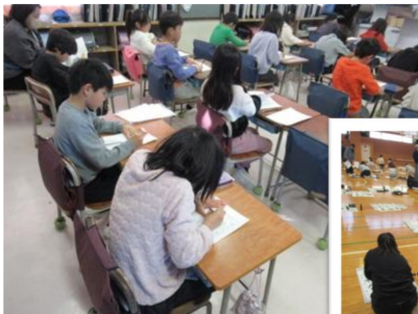
1・2年生は各教室で硬筆

1月19日(月)～30日(金)の期間、校内書初め展が行われました。ご来校くださった皆様、ありがとうございました。書初めは日本の伝統的な年中行事の一つです。3学期が始まった最初の週に、気持ちを新たにして、全校児童が挑みました。硬筆や毛筆で、それぞれの課題の字の注意するところを意識して取り組みました。6年生は、小学校生活最後の席書会でした。今まで積み上げてきた練習の成果を発揮しようと真剣に臨む姿は、とても凛としたものでした。