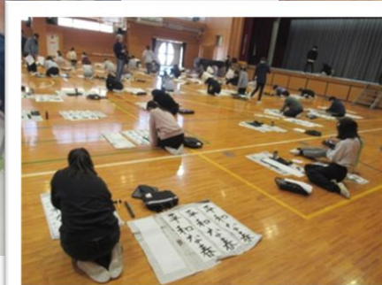
3～6年生は体育館で毛筆