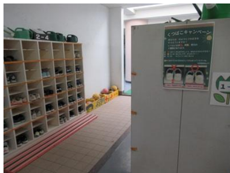
代表委員会のポスター