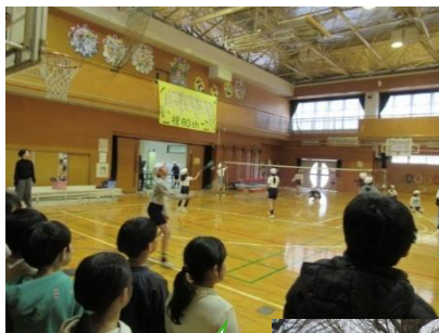
バドミントンクラブ

なお3学期に2回、3年生のクラブ見学が行われます。クラブの様子や楽しさが伝わるように、6年生の各クラブ長を中心に、紹介の仕方を考えています。