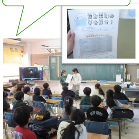
図書委員会の取り組み

祖師谷小学校のみんなが読書好きになるように、本を 大切にできるように、アイデアを出し合っています。