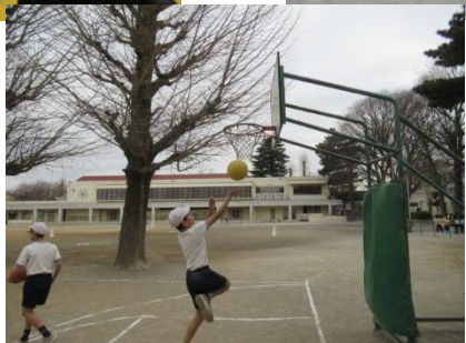
バスケットボールクラブ