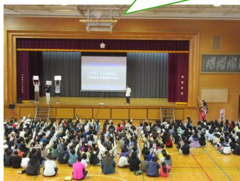
環境委員会の発表集会

温暖化のために、未来に起こるかもしれない 自然災害をクイズにしたよ。みんな真剣に考えられたね。