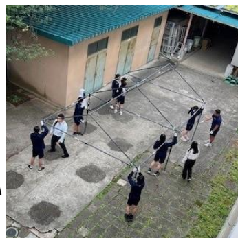
【放課後テントの確認をする生徒会】

今年のスローガンは「燃志挑戦～学年の壁を越えて～」。これまで、体育や学年練習そして放課後練習を重ねてきました。同時にクラスごとの模造紙づくり、そして実行委員をはじめ各担当の準備などなど、よく頑張ってきました。このスローガンのもと、運動が得意な人もそうでない人も今までの自分を超越するよう頑張って、さらにお互いが盛り上げ応援し合えば最高です。