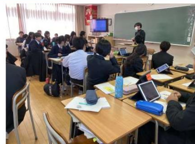
1年生 日本語(対話の基礎)

日本語の授業で、対話の基礎を学習しました。相手の話を聞く態度や相手への質問の仕方など、普段の何気ない対話で、留意する点をワークを通して学びました。多くの人と友好的な関係を築ける対話のプロフェッショナルを目指しましょう！(竹護)