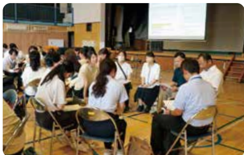
幼保・小・中の教員をつなぎ、学びの連続性を作る「合同研究会」

「キャリア・未来デザイン教育」を実現するためのキーワードは、「キャリア教育」と「せたがや探究的な学び」です。「キャリア教育」では、児童・生徒が学ぶことや協働することの意義を実感できるように学校や地域等の実態に応じた特色ある教育活動を充実させます。「せたがや探究的な学び」では、自ら問いを見出し、自分なりの方法で問題を解決し、友達と協働しながらさらに見方・考え方を深め、自分の学びを振り返ることで新たな課題を見付けていく探究的な学びのサイクルを循環させます。