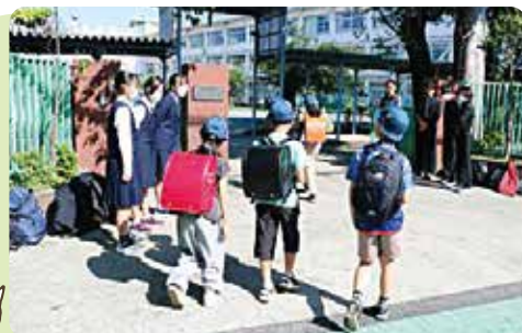
小・中交流の「あいさつ運動」