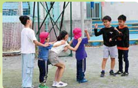
幼保・小のつながりを深める「はじめましての会」