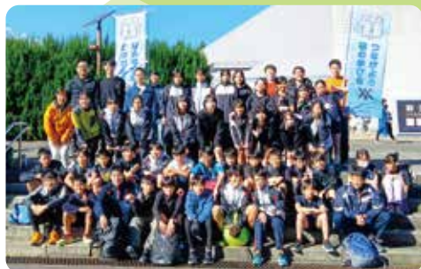
砧の学び舎チームでタスキをつなぐ「子ども駅伝」