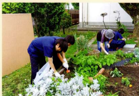
花壇ボランティア