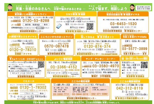
子供向け相談窓口一覧