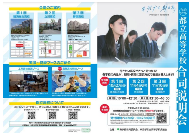
↑都立高等学校に合同説明会