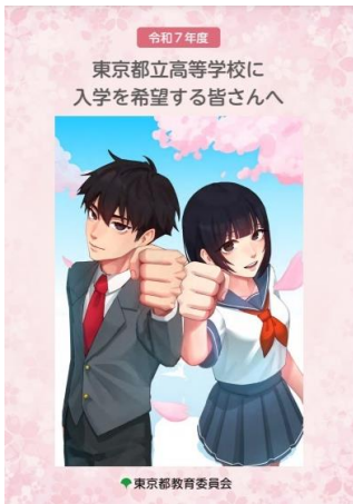
↑東京都立高等学校に入学を希望する皆さんへ

都立高等学校については、東京都教育委員会のホームページでも様々な情報が提供されております。「東京都立高等学校に入学を希望する皆さんへ」は、3年生に対しては冊子で配布となっておりますが、ホームページからどなたでも見ていただけるようになっております。他にも「都立高等学校合同説明会」や「東京都高等学校文化祭」なども紹介されておりますので情報として提供させていただきます。