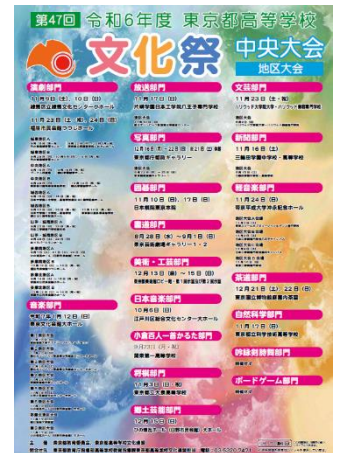
↑東京都高等学校文化祭

「こどもの人権SOSチャット」 法務省の人権擁護機関においてインターネットブラウザを介してアクセスできるチャット形式による人権相談「こどもの人権SOSチャット」の運用が開始されています。(iPadのブックに格納されています。)