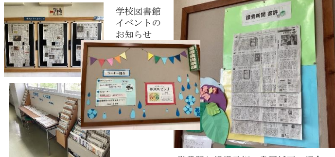
学校図書館イベントのお知らせ