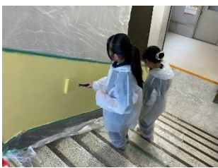
階段プロジェクト作業の様子。