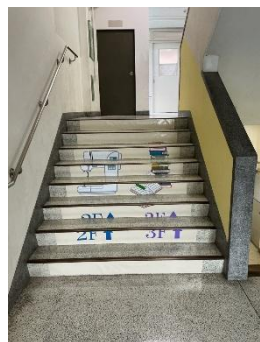
南階段に張られたイラスト

階段のペンキ塗りを行いました。 今年度から、始まった東京都市政策連携室及び東京都医学総合研究所との連携プロジェクトである「学校の居心地プロジェクト」において、学校の実行プロジェクトが開始しました。第一段として始まったのは、迷路のような駒沢中学校で、迷子を防ぐためのプロジェクトである階段プロジェクトです。階段に色を塗ったり、どこにつながる階段かすぐにわかるように、写真のようにイラストを掲示したりするなどの工夫を行いました。 作業は、10月22日と29日の放課後に、生徒