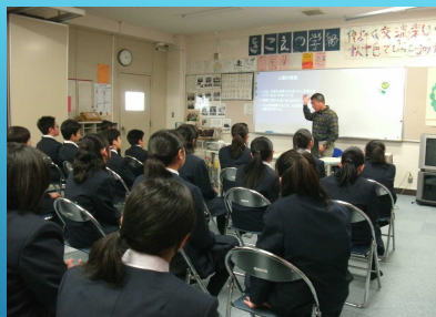
難聴理解授業（1年生）