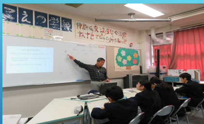
取り出しによる指導