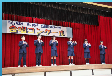
ろう者の講師による手話指導（手話部として一般生徒も参加可能）