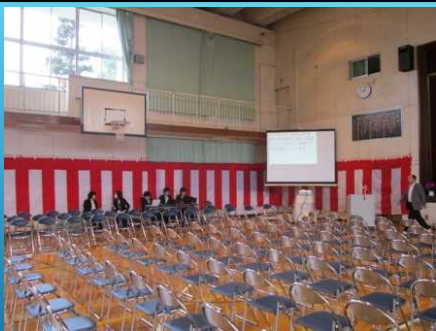
スクリーンによる情報保障