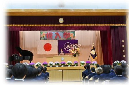
歓迎の言葉 (3B 古屋 真汎さん)