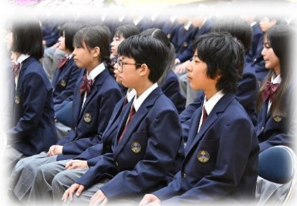
しっかりと話に集中する新入生

4月7日(火)、大きな夢と希望を胸に抱いた一年生が三宿中の門をくぐりました。新入生代表生徒から、『一日、一日を大切にし、中学生としての責任と自覚をもち、勉強に部活動に全力で取り組んでいこうと思います。』と、力強い宣言がありました。早く新しい生活に慣れ、恵まれた教育環境で伸び伸びと生活できるよう応援します。152名の新入生の皆さんの入学を心より歓迎します！