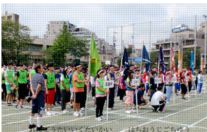
106 連合体育大会 八王子五中にて