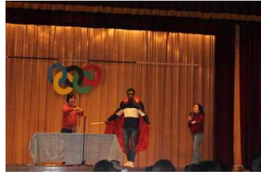
(サイエンスマジックショー)