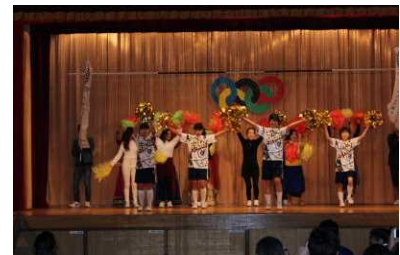
(オープニングセレモニー)