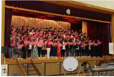
( 合 唱 )