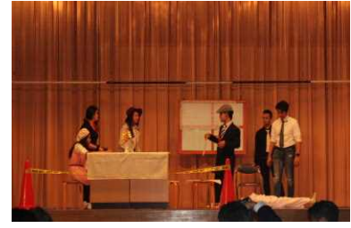
( 劇 )