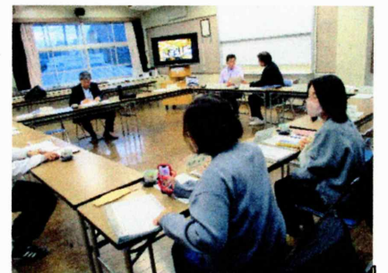
学校運営委員会の様子