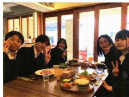
ある班の昼食タイムのーコマ