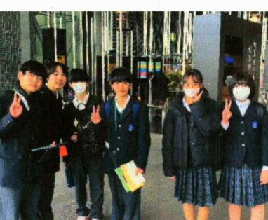
日本科学未来館での活動

5月末に行った「河口湖移動教室」以来の校外活動となりました。各班の班長を中心に決まり事を守り、周囲への配慮を忘れず、目的意識をもって行動ができました。下の写真は午後の見学施設での様子です。写真を見て当日を振り返りましょう。