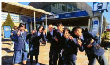
移動中(東京テレポート)

昼食後は、各班で決めた施設へ移動、施設の方の説明を聞き、展示物の見学・体験を行う事が出来ました。