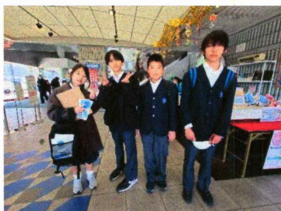
東京都水の科学館

5月末に行った「河口湖移動教室」以来の校外活動となりました。各班の班長を中心に決まり事を守り、周囲への配慮を忘れず、目的意識をもって行動ができました。下の写真は午後の見学施設での様子です。写真を見て当日を振り返りましょう。