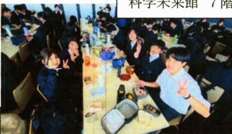
科学未来館 7階：食堂 昼食の様子