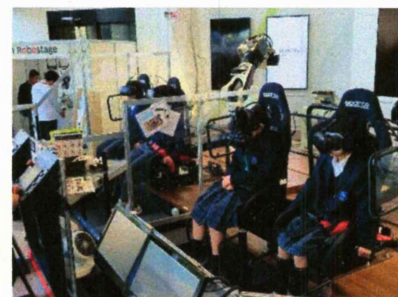
カワサキ ロボステージ