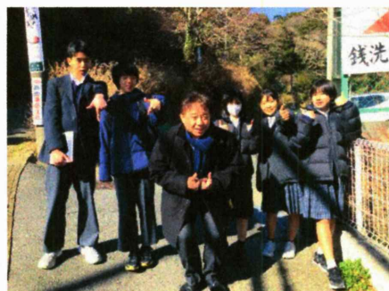
銭洗弁天で校長先生とパシャリ