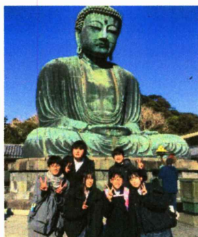
鎌倉大仏様と一緒に♪