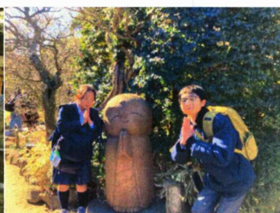
長谷寺マスコット！和み地藏