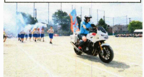
体育祭：聖火セレモニーの様子

会場の観客からは大きな熱意ある拍手喝さいをいただいた記憶がまだ鮮明に覚えています。皆様はいかがだったでしょうか。