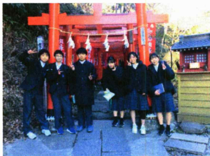
佐助稲荷神社の鳥居の前で