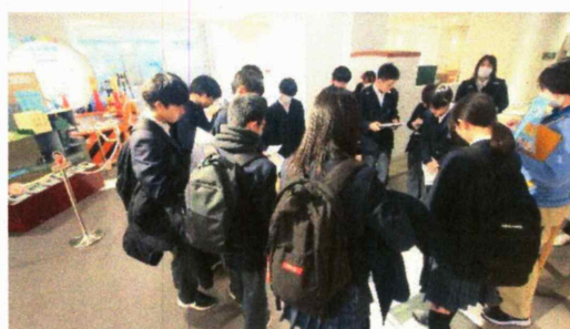
東京都虹の下水道館