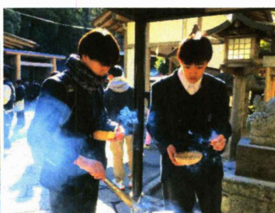
銭洗弁天でお線香のお供え