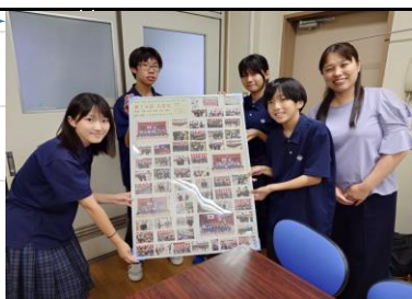
入学式パネルが完成♪