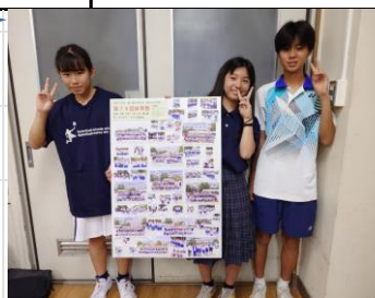
体育祭パネルが完成♪