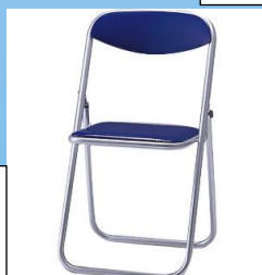
アルミ製パイプ椅子 単価 7,700 円