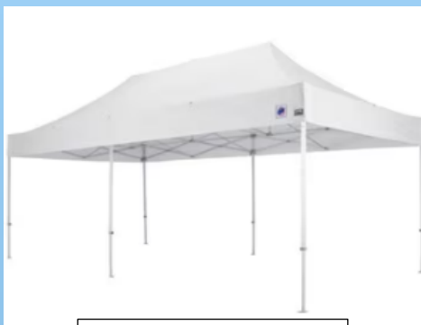
イージーアップテント 単価約300,000 円