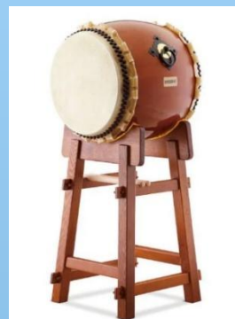
和太鼓 220,000 円