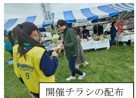
開催チラシの配布