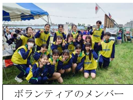
ボランティアのメンバー