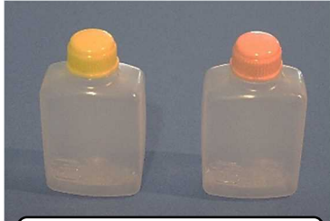
お弁当のしょうゆびん