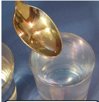
なかったら スプーンでもOK！