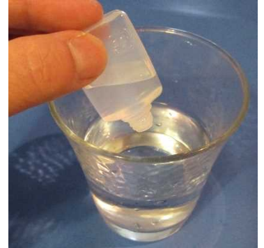
水をすいとるための べつのコップ