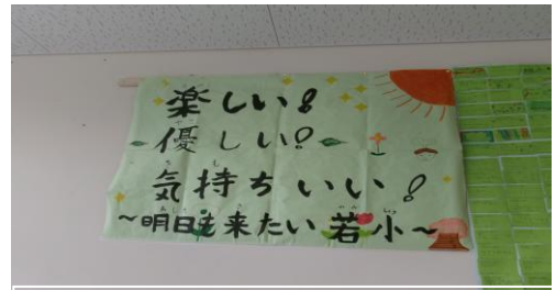
明日も来たい若小の姿を児童全員が考え、一人ひとりカードに書きました。実現できるように努力しています。(昇降口に掲示しています。来校の際にご覧ください。)