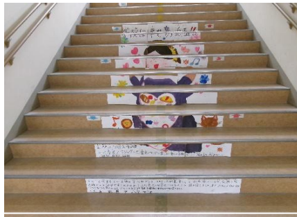
6年生が、心が温くなる絵や言葉を階段に貼り、人権の大切さを呼びかけました。～階段アート～