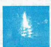
夜はみんなでキャンプファイアー! 火を囲んでみんなでFIRE!