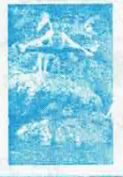
大きな器からスーパージャンプ!! そのまま川へスライダー