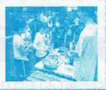
ご飯はみんなで作ります!! 自給ゼクッキングKING!